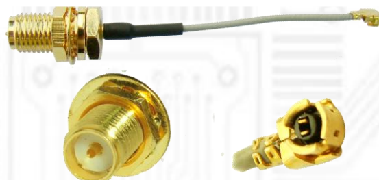
U.fl/IPX→RP-SMA メス変換 RF ケーブル