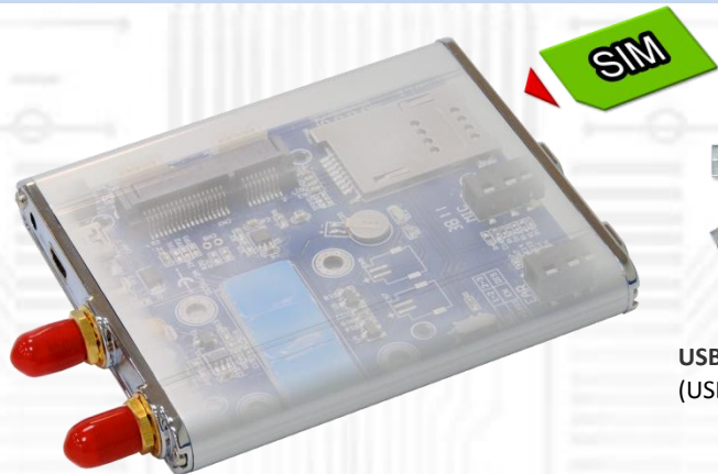
USBMS-D (無線通信 Mini Card 用 USB アダプタ ver1.2) x1 IPX→RP-SMA メス変換 RF ケーブル: 2 本内蔵済