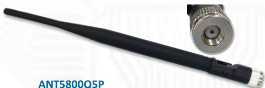
ANT5800Q5P 5.8GHz 5dBi ラバーダックアンテナ