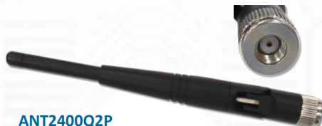
ANT2400Q2P 2.4GHz 2.15dBi ラバーダックアンテナ