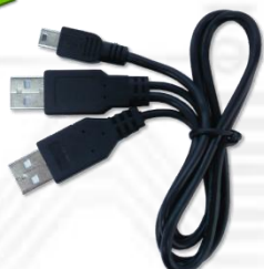
USB-Y-Line-2.0 (USB 2.0 Y 字ケーブル) x1