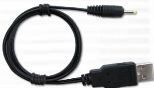
P25AMTDC60 (USB-5VDC 電源ケーブル) x1