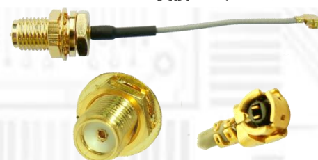
U.fl/IPX→SMA メス変換 RF ケーブル

ビープラス・テクノロジーは2009年3月以来、高品質のコンピュータ接続製品の製造者として広範囲のアップグレード用製品を提供してきました。弊社製品はデスクトップ・ノートブック PC を問わず外部周辺機器との橋渡し役としてご好評いただいています。